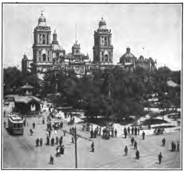
en la Ciudad de Méjico

son la plata, el oro, el plomo, el hierro, el cobre, el mercurio, el estaño, el azufre, el petróleo y el carbón.